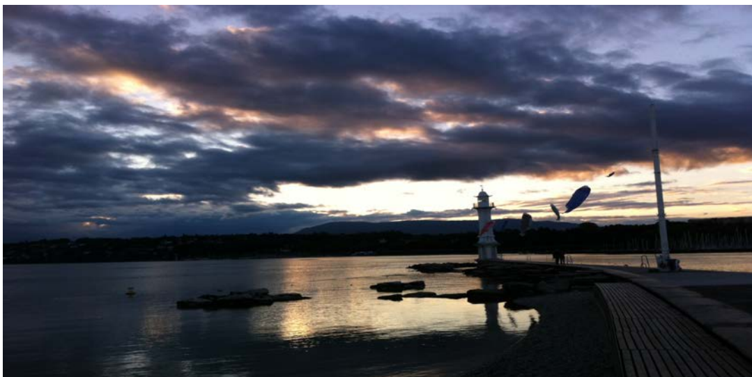
Aube civile, Bains des Pâquis, Genève, 24 août 2014, 06 :45

Pour Love Song (46°12'N) , le public est donc convié aux Bains des Pâquis des 5h03 du matin, pour une performance qui commence à 5h13 et va, sur un peu plus d'une heure, embrasser le temps de l'aube civile.