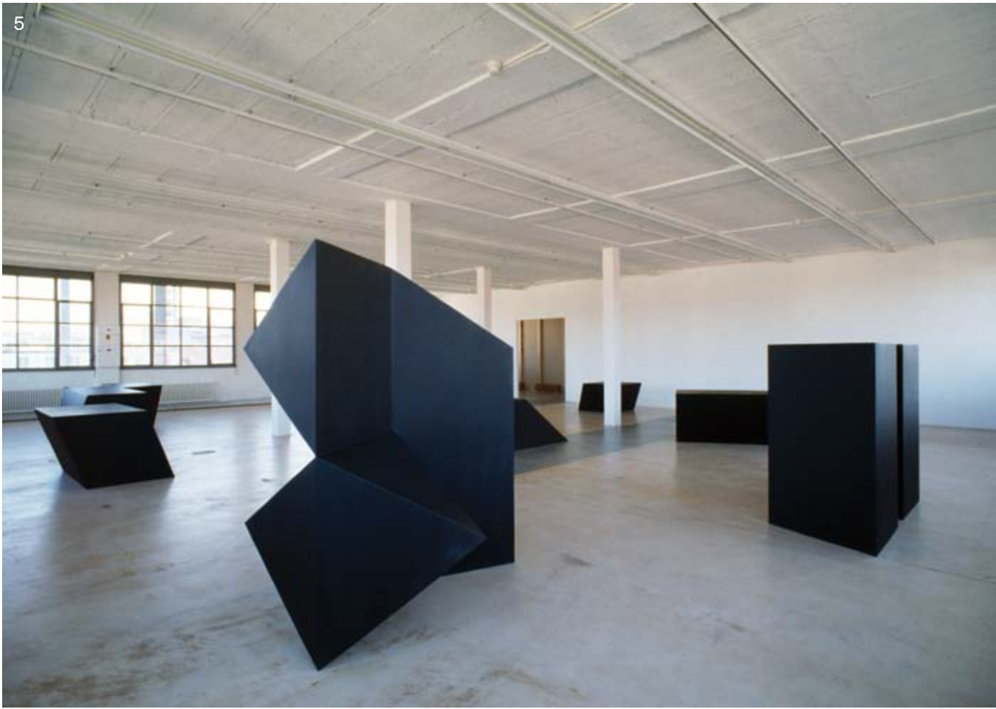
1 Cycle Rudiments d'un musée possible 1 Tony Smith Serie for... 1995 Œuvres de Tony Smith

Gaspé comm Maga Perso ⇒ ast de Hu 2. M grand dans M. photo absol M. INE - Magl ⇒ no bin n M. « mag ⇒ al man d'un Persu Chat teur» qui e chose M. prod inex caba -mar tion, men sort, grin sans espe un | mai — Ti tati con (cf. no. l les Ma Ces près N mag la i sur ma phi Per ma des ma ext me ma Nai J ma J d'e