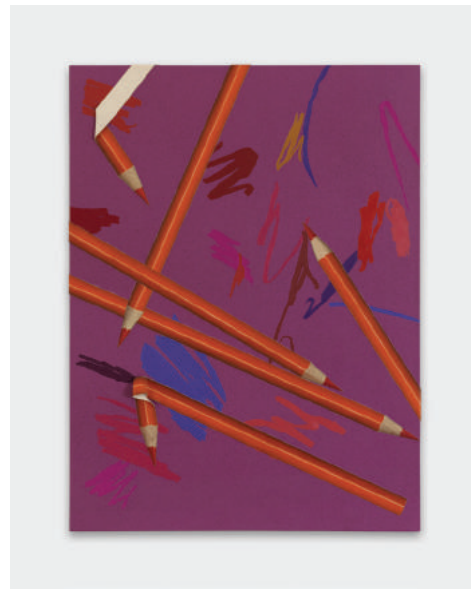
Greg Parma Smith, Colored Pencil Techniques IV , 2010, collection privée.