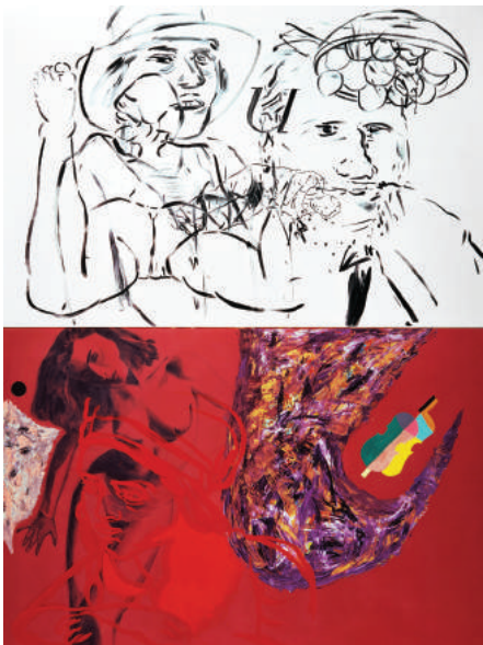
David Salle, Zeitgeist II, 1982